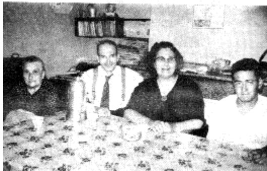
Federica Montseny con su hijo, su marido Josep Esgleas (Germinal) y su madre política, en Toulouse, 1952.

La revolución social, con la desaparición de la burguesía y de las estructuras capitalistas y autoritarias, deberá establecer una nueva ordenación económica, que implicará necesariamente otras modalidades de trabajo, reajustes de fabricación, reconversiones profesionales, especialidades distintas de la producción. Los sindicatos por profesión o industria tampoco habrán de disponer de poder político ni de propiedad de fábrica, de maquinaria o de productos elaborados. Al propietarismo corporativista tampoco hay que dejarle tomar raíz en la sociedad anarquista o comunista libertaria.