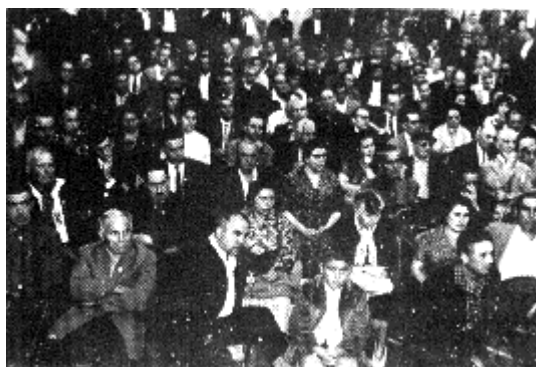
Miting de la CNT en el Palacio de los Deportes en Toulouse en 1960.

»1. Abolición de la propiedad privada de la tierra, de las materias primas y de los instrumentos de trabajo, para que nadie pueda vivir explotando el trabajo ajeno y todos, al ver garantizados los medios de producir y vivir, sean realmente independientes y puedan asociarse a los demás libremente, por el interés común y según las propias simpatías.