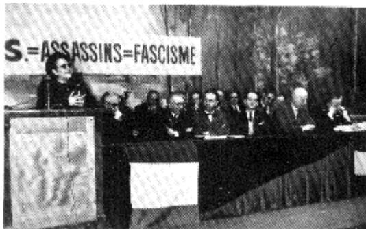
Federica Montseny en el Miting de la Alianza Sindical. París 1964.

Ella correspondía al Punto 6.º: «La organización de la economía en una sociedad anarquista, o durante la etapa de transición revolucionaria hacia la anarquía».