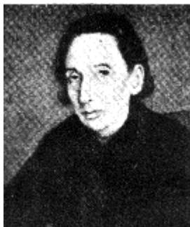
Luisa Michel, cofundadora con Sebastián Faure de «Le Libertaire»

concepción de la República por la que combatían difería mucho de lo que fue la proclamada en 1871 y que tan efímera vida tuvo.