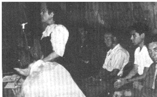
Colonia de Aymare (Francia). Intento de colectividad agrícola. 1952.

El anarquismo emergió lentamente de la terrible prueba que para él habían sido la pérdida de la guerra y de la revolución en España, los diversos avatares de esa experiencia y el paso del nazi-fascismo por una Europa devastada y dividida.