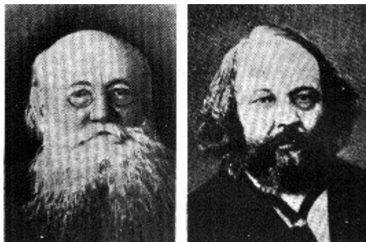
Kropotkin y Michael Bakunin.

que el tema de la organización de la vida en una sociedad liberada del Estado pensaron los anarquistas.