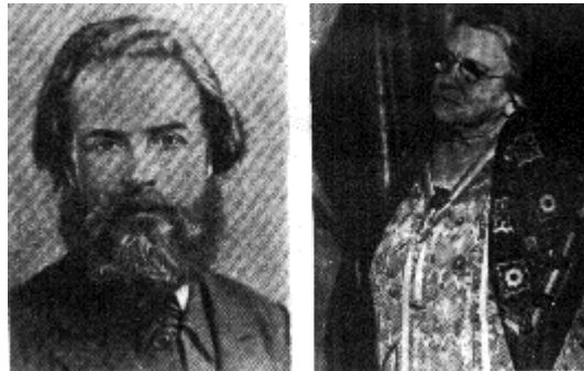
Eliseo Reclus y Emma Goldman.

Más cerca de nosotros, tampoco es desdeñable la obra realizada por Hem Day y sus cuadernos «Pensamiento y acción».