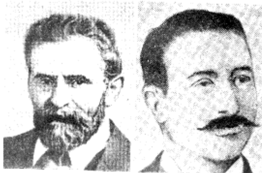
Enrique Malatesta y Pietro Gori.

Durante todo el siglo XIX y parte del XX, Suiza fue uno de los centros de reunión internacional de los anarquistas. Los rusos, perseguidos, allí iban a parar. Allí murió Bakunin. Y cuando se produjo la división de la Internacional, la Federación del Jura, una de las más importantes de la Primera Internacional, siguió la línea bakuninista. Había una potente organización obrera —la de los relojeros— y hubo un hombre, amigo personal de Bakunin, que tuvo enorme influencia sobre el proletariado suizo y los diversos grupos étnicos en Suiza refugiados. Nos referimos a James Guillaume. Muerto éste, le sucedió, en la misma obra y con considerable influencia, Luigi Bertoni, que publicó durante largos años, «Le Réveil - Il Risveglio», revista en francés y en italiano, que había sido fundada por el propio Kropotkin, que en Suiza vivió también varios años refugiado.