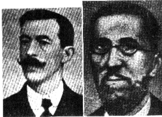
Ricardo Mella y Fermín Salvochea.

Esta fue la actitud mayoritaria dentro del anarquismo mundial. Los 16 fueron duramente juzgados y sólo poco a poco, al producirse otros acontecimientos, como fue la revolución rusa, ese episodio fue olvidado y los militantes, que por sí mismos se relegaron al ostracismo, volvieron a ocuparse de los problemas vitales que la duración de la guerra y el estallido de la Revolución en Rusia hacía emerger del general maremagno.