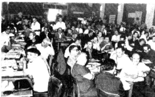
Congreso Intercontinental de la CNT de España en el exilio. 1965