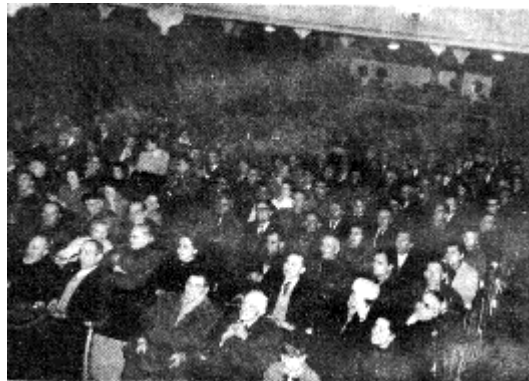
Miting de la CNT española en Marsella, en julio de 1970.

Hasta la fecha, experimentalmente, como expresión práctica y eficaz de realización colectivista-comunista viviente, puede ofrecerse el de las colectividades de tipo libertario durante la Revolución española, en una situación dada de trascendental realismo histórico, manifestándose como organismos eficientes para asegurar el desenvolvimiento económico de un pueblo, sobre todo desenvolviéndose vinculadas de concierto con los sindicatos y demás organismos comunales, complementarios unos de otros y atendiendo, cada uno en su esfera delimitada y característica respectiva, las necesidades y funciones económicas y sociales inherentes a la sociedad o comunidad.