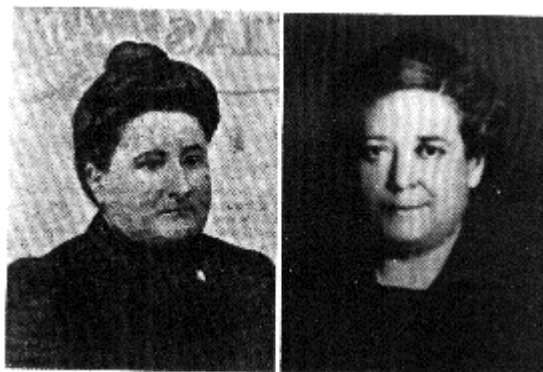
Teresa Mané (Soledad Gustavo), madre de Federica Montseny, y Teresa Claramunt (Sabadell 1862-1931), oradora y propagandista libertaria.

En aquellos días, la C. N. T., la F. A. I. y el movimiento libertario en su conjunto vivieron horas muy difíciles. Y el que resistieran victoriosamente a la ofensiva combinada de la reacción y de los socialistas, que querían imponer la U. G. T. en detrimento de la C. N. T., demuestra el arraigo profundo que tenía nuestra organización en la conciencia del pueblo. Además, era la única organización independiente, no ligada a ningún partido y que pudo, con las manos libres, identificarse con los anhelos y las necesidades populares. La República no regateó las persecuciones contra la F. A. I. y la C. N. T. En la memoria de todos hay todavía las deportaciones a Bata y a Río de Oro, la represión desencadenada después de los sucesos de Figols y un año después de Casas Viejas y, más tarde, en 1934, las atrocidades cometidas contra los trabajadores, esta vez todos unidos, Genetistas, ugetistas, socialistas, comunistas y anarquistas en Asturias, después de la insurrección abortada y en pleno bienio negro. Allí demostró ya sus dotes de estrategia y lo implacable de su carácter, un joven general republicano llamado Francisco Franco. Digo republicano, porque Franco, como Queipo de Llano, Yagüe, Cabanellas, Várela, López Ochoa y tantos otros, habían jurado fidelidad a la República.