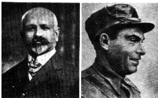
Francisco Ferrer y Guardia y Buenaventura Durruti.

Sería, no obstante, limitar la acción libertaria, si la circunscribiéramos a la simple intervención de los anarquistas en el movimiento obrero. Son centenares las revistas publicadas, los periódicos. Se suman por millares los libros y folletos editados. Desde las Escuelas laicas de Gabarro, a las Escuelas racionalistas que se multiplicaron en España en los años que van de 1915 a 1936, pasando por el ensayo heroico de Ferrer Guardia, que quiso crear una Escuela Moderna en España (ensayo que le costó la vida, ya que fue muerto fusilado por el solo crimen de haber intentado fundar una escuela liberada de la influencia religiosa en un país donde la Iglesia era todopoderosa y su criterio y sus procedimientos impregnados todavía del espíritu de la Inquisición), la labor libertaria fue múltiple, constante y lo abarcó todo, sin descuidar ningún aspecto.